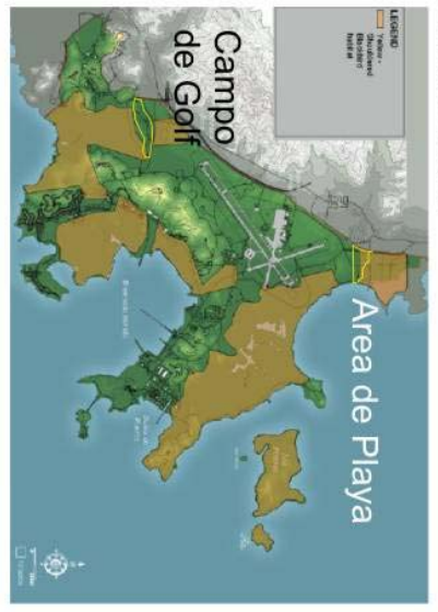
Figure III.15 Yellow Shouldered Blackbird, 1980 Agreement

The presence of the Yellow Shouldered Blackbird (YSBB), a species of "Critical Concern", is one of the more sensitive environmental issues that the reuse plan will address. Its area of natural habitat is the mangrove forest; the extent to which the birds nest in areas beyond those boundaries will be addressed in the on going environmental assessment.