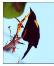
Figure III.16 Yellow Shouldered Blackbird

The presence of the Yellow Shouldered Blackbird (YSBB), a species of "Critical Concern", is one of the more sensitive environmental issues that the reuse plan will address. Its area of natural habitat is the mangrove forest; the extent to which the birds nest in areas beyond those boundaries will be addressed in the on going environmental assessment.